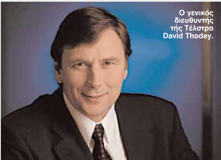
Ο γενικός διευθυντής της Τέλστρα David Thodey.

ΣΤΗ ΦΩΤΟΓΡΑΦΙΑ, ο πρωθυπουργός, Κέβιν Ραντ και ο αρχηγός της αντιπολίτευσης, Μάλκολμ Τέρνμπουλ, μονομάχοι στη Βουλή.